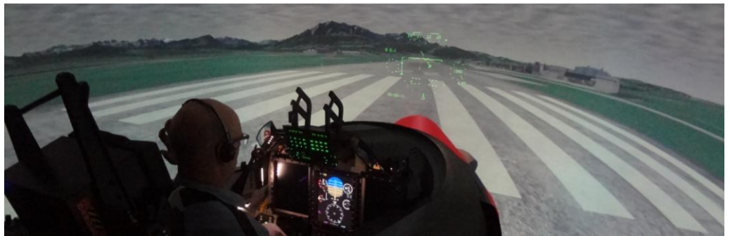
PC-21 Simulator beim „Start“ in Emmen