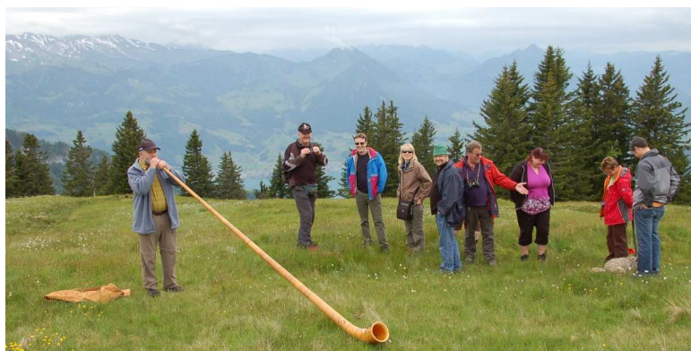
Openair mit Alphorn