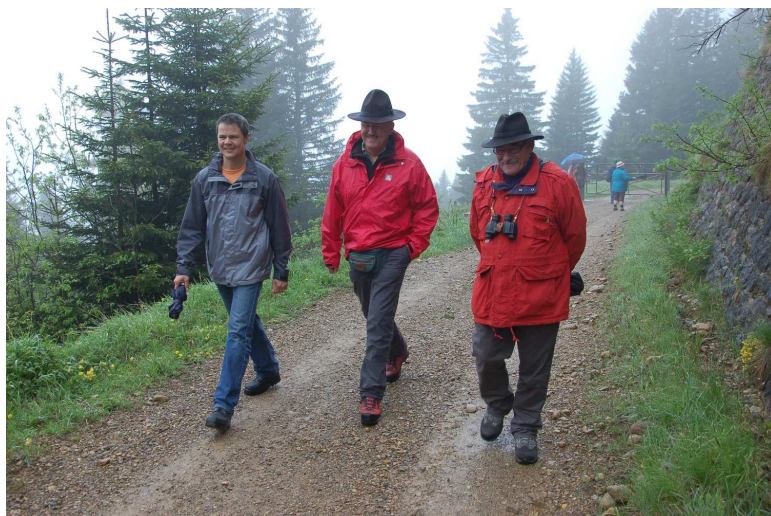
Wanderung bei Infantriewetter

13 Waldstätterinnen und Waldstätter fanden am Samstag 12. und Sonntag 13. Juni 2010 den Weg auf die Rigi-Scheidegg. Petrus versuchte allerdings mit allen Mitteln uns die gute Laune zu verderben, was ihm aber gründlich misslang. Trotz Nebel fanden wir den Weg zum Scheidegg-Rundgang, erfuhren einiges über Jugendsünden, hatten eine ausgezeichnete Stimmung und genossen die einheimische Küche und das Älplerbuffet im Berggasthaus Rigi-Scheidegg.