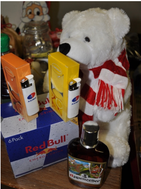
Der begehrte Teddybär...