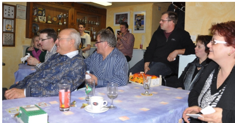
am Spielabend „Vo dem red mer ned, das hed mer“.