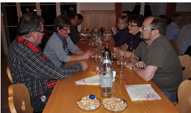
Chlauhöck im Restaurant Alpenhof in Küssnacht am Rigi