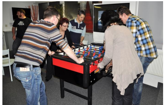
Ob kegeln oder „töggele“, es wurde gespielt und gezockt.