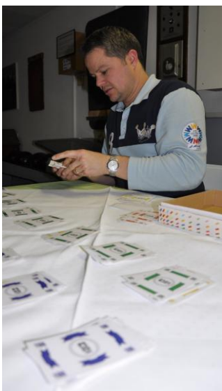
Der Technische Leiter als Kassier